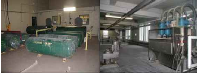
Usine de filtration, St-Hyacinthe